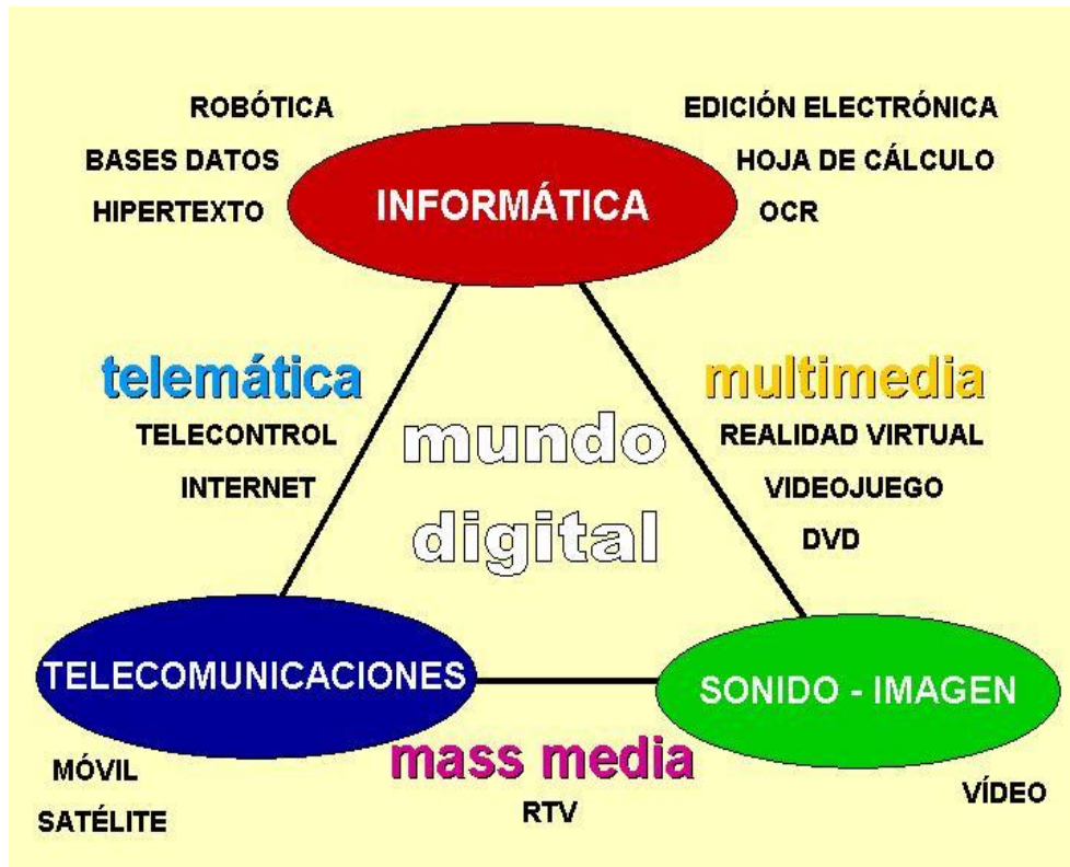
Diagrama sobre la relación Informática-telecomunicaciones y Sonido e imagen (TIC'S)

Infografías, gráficos, mapas, líneas de tiempo, etc.